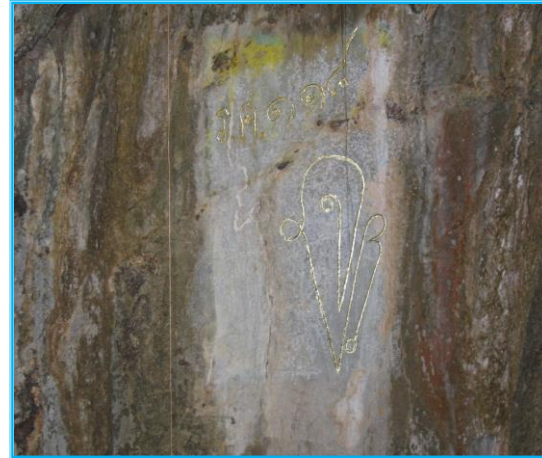
พระพุทธรูปภายในถ้ำสาริกาและพระปรมาภิไธย ย่อ จปร. ปี ร.ศ. ๑๑๘ (อยู่บริเวณหน้าถ้ำ)